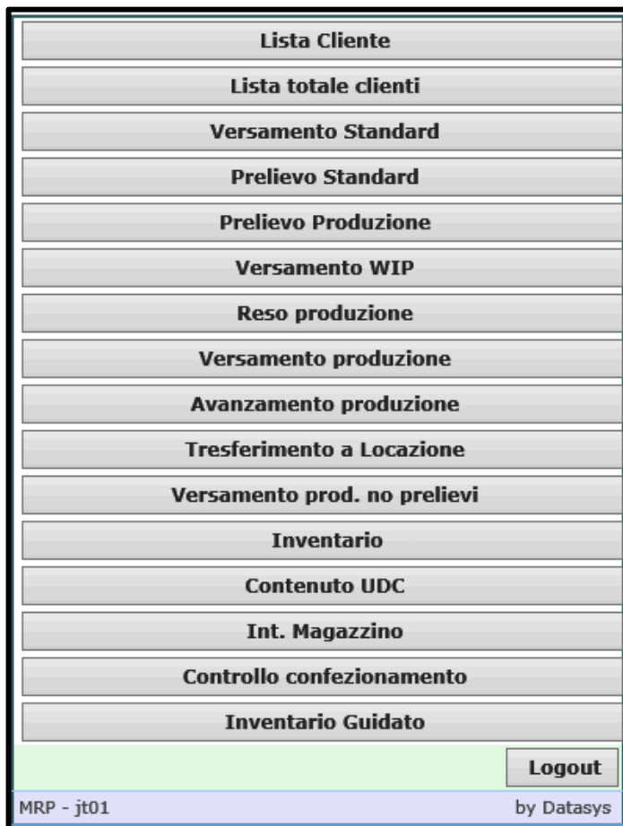
Fig.1 Esempio di terminale, configurabile in base alle esigenze del cliente.

La movimentazione delle merci viene registrata in entrata/uscita con PC tradizionali o attraverso terminali e palmari in radio frequenza RFID, e specifiche funzioni analizzano le giacenze di magazzino, suggerendo all'operatore i prodotti da approvvigionare, in modo da mantenerle sotto controllo e garantire un ottimale livello di servizio.